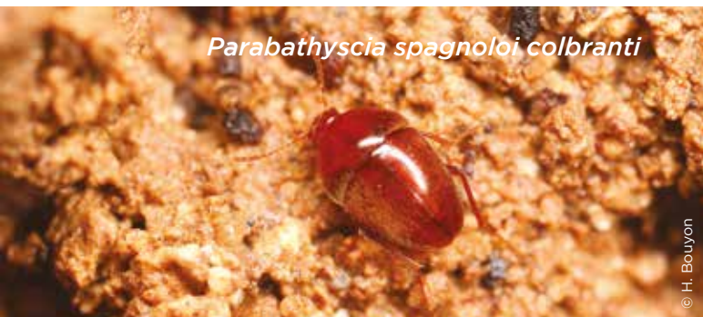
Parabathyscia spagnoloi colbranti

Enfin, 2 chrysomèles méritent notre attention, Cryptocephalus loreyi , qui se rencontre dans la moitié sud sur les chênes, répandue mais toujours rare, et Crioceris macilenta , présente dans le sud-ouest du bassin méditerranéen, vivant sur les asperges, non rare en Corse, mais très rare sur le continent. Malheureusement, les conditions climatiques ont fortement limité le nombre de découvertes potentiellement intéressantes dans ce groupe également.