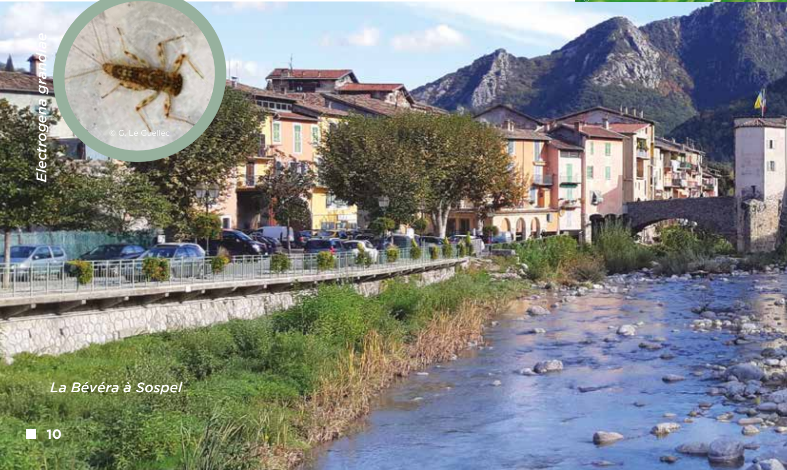
La Bévéra à Sospel