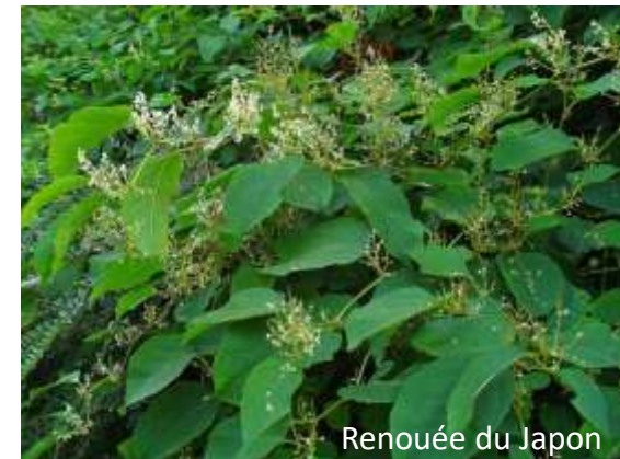
Renouée du Japon Invasive avérée secondaire