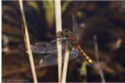
Leucorrhine à gros thorax (EN)

17 % des taxons sont menacés en région Centre-Val de Loire