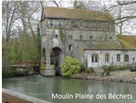
Moulin Plaine des Béchets