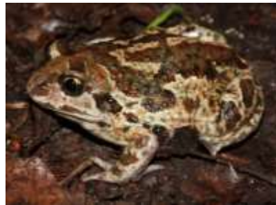
Pélobate brun (CR)