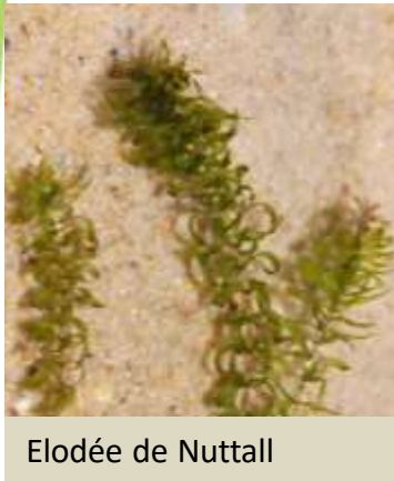
Elodée de Nuttall Invasive avérée secondaire