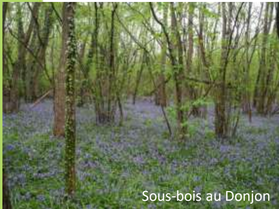
Sous-bois au Donjon