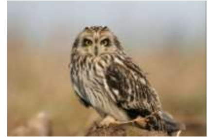
Hibou des marais (CR)