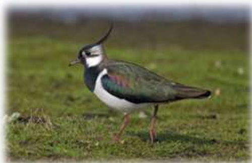
Vanneau huppé (VU)