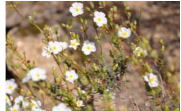
Hélianthème en ombelle