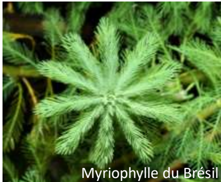
Myriophylle du Brésil Invasive avérée prioritaire

...mais aussi des espèces invasives ! (11 espèces)