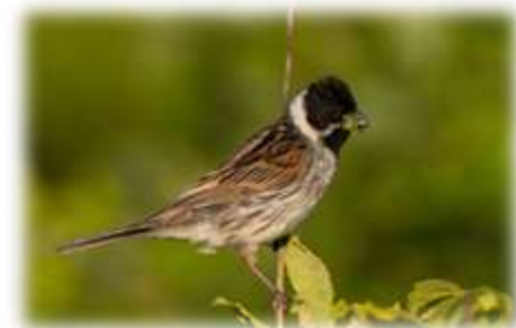
Bruant des roseaux