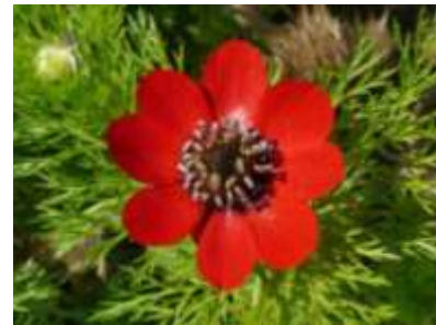
Adonis couleur de feu (CR)