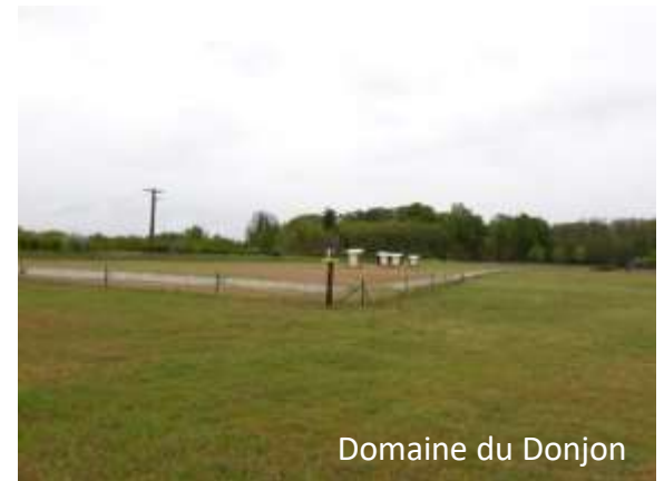
Domaine du Donjon