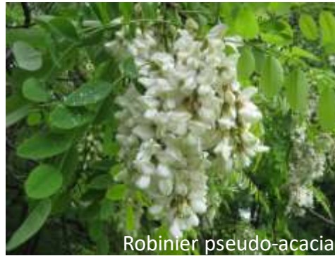
Robinier pseudo-acacia Invasive avérée secondaire