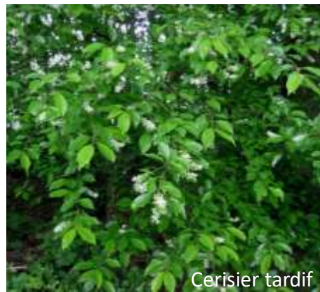
Cerisier tardif Invasive avérée secondaire