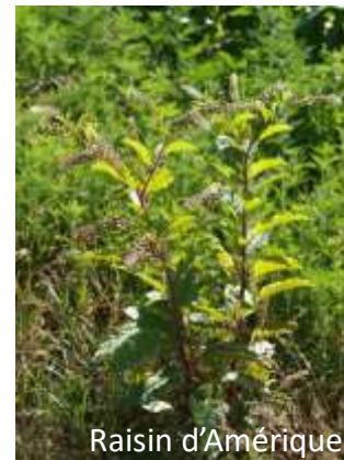
Raisin d'Amérique Liste d'observation