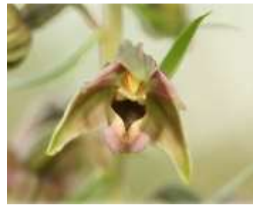
Epipactis à larges feuilles