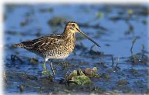
Bécassine des marais