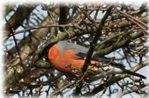
Bouvreuil pivoine (VU)