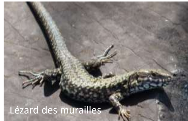
Lézard des murailles