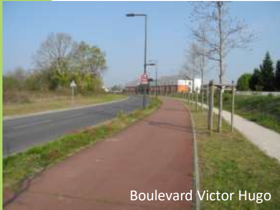
Boulevard Victor Hugo

➔ Quelques-uns des sites et milieux étudiés :