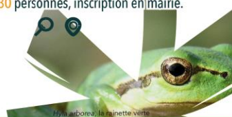
Hyla arborea, la rainette verte