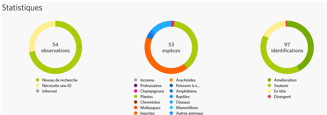
Figure 1: Statistiques liées à la page projet INaturalist ABC de Concoret