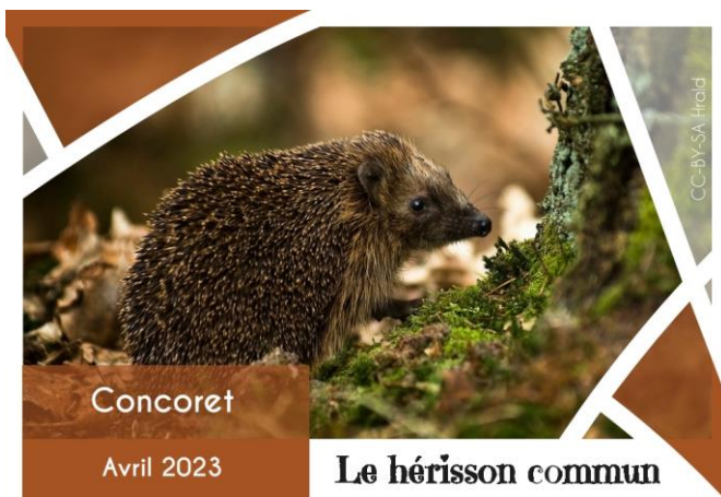
Illustration 3: carte postale