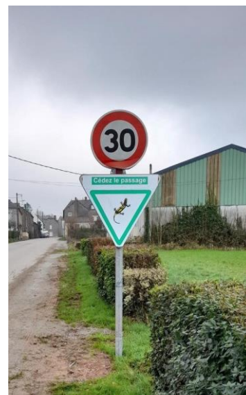
Illustration 2: panneaux routiers