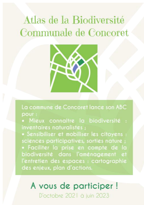
Illustration 1 : flyer